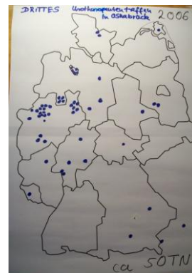
Osnabrück '06: 50TN