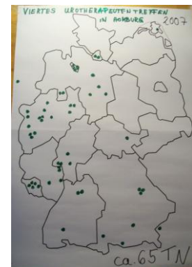
Homburg '07: 65TN