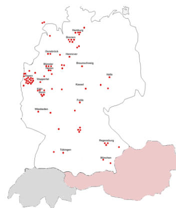
Essen 2010: 80 TN