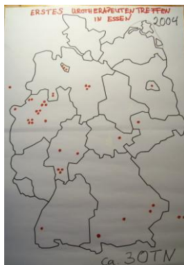
Essen 2004: 30TN