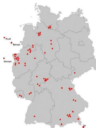
München 2009: 65TN