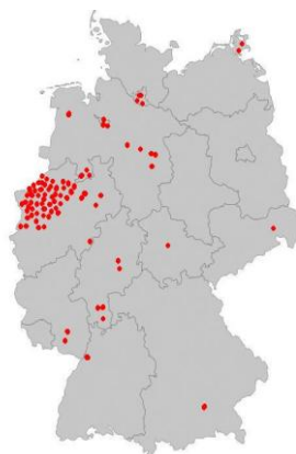
Haltern 2008: 79TN